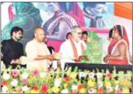
यूपी के सीएम योगी आदित्यनाथ एक कार्यक्रम में शामिल हुए।